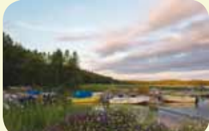
RAIRANTA www.rairanta.fi 270 sähköpaikkaa, kauniin merenlah- den rannalla 7 km Uudestakaupungis- ta etelään. Matala hiekkaranta, veneitä. Vanhakartanontie 216, 23500 Uusikaupunki. Puh. 02 841 7400, 0500 825 899