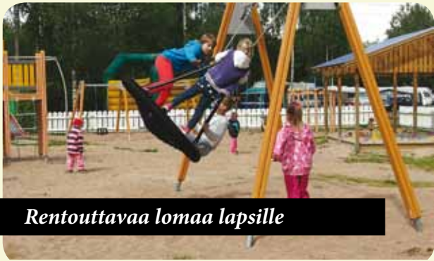
Rentouttavaa lomaa lapsille