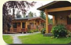
RANTASARKA www.sfc-oulu.com 164 sähköpaikkaa, meren rantaan 100 m. Hyvät ulkoilu- ja maastot. 25 km Oulun keskustasta pohjoiseen. Mustakarintie 46, 90810 KIVINIEMI Puh. 050 494 3101