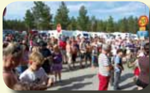
KALAJÄRVI www.caravan-kalajarvi.fi 300 sähköpaikkaa. Kalajärventie 4, 61100 PERÄSEINÄJOKI Puh. (06) 417 5602

Toivotamme Teidät lämpimästi tervetulleeksi Caravan Huiput -alueille!