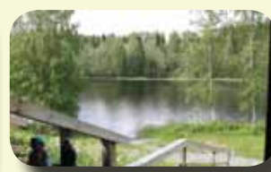
MAISANSALO www.maisansalo.fi. Tampere 300 sähköpaikkaa. Kuterintie 34, 34260 TERÄLAHTI (Teisko). Puh. 050 412 3123