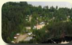
REKINIEMI www.pielisenkarjala.fi. Lieksassa Pielisen rannalla 100 sähköpaikkaa. Rauhallinen alue, hyvät kalastus- mahdollisuudet. Rekiniemi 4, 81590 VUONISLAHTI Puh. 040 702 5745