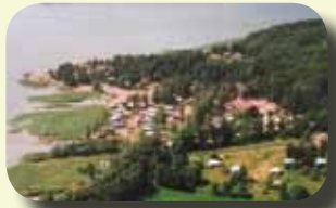
CAMPING MUSSALO www.sfc-mussalo.fi 120 sähköpaikkaa. Mussalontie 356, 23310 TAIVASSALO Puh. 040 764 9391