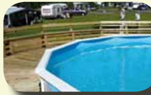
TILKUNPELTO www.sfc-kantahame.com 150 sähköpaikkaa. Vaunusauna, uima-altaat ja tanssilato Teurojär- ven rannalla. Mulkolantie 330, 16900 LAMMI Puh. 050 370 1435